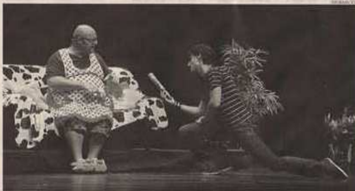
Una comedia que, seguro, cumplirá con las expectativas de los aficionados a este tipo de teatro en el Espinel.

Comedia y monólogo se mezclan en esta obra en la que el teatro es el verdadero protagonista. Un escenario casi desnudo y dos