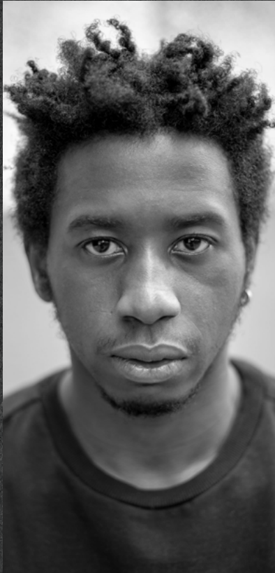
MARD B. ASE