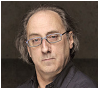
Torelló (Barcelona), 1956

Licenciado en Arte Dramático por el Institut del Teatre de Barcelona. Fue miembro de la compañía de teatro La Gàbia de Vic (Barcelona) como actor y ayudante de dirección.