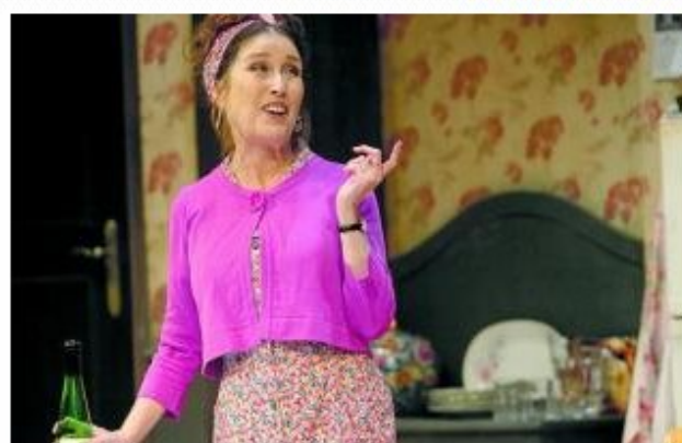
Vacaciones de la vida

SAÚL FERNÁNDEZ Lo que pasa en Liverpool, está claro, también sucede en Avilés, en Clermont-Ferrand y hasta en Milwaukee. Y lo que pasa en Liverpool, en el Liverpool pintado por el dramaturgo británico Willy Russell, es que una ama de casa se ha cansado de ser una ama de casa porque quiere empezar a vivir, encontrar el sol, el sol que brilla en los crepúsculos de las islas griegas, que son crepúsculos de seducción, atardeceres mejores, finales de día que anuncian jornadas estupendas.