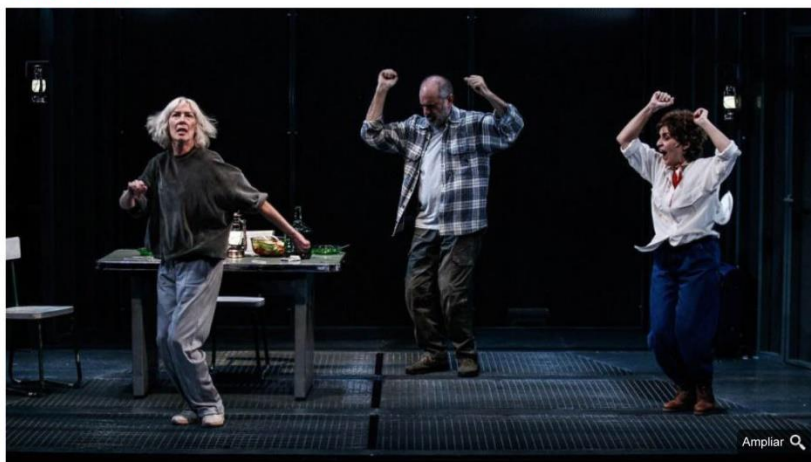
Obra de teatro 'Los hijos'