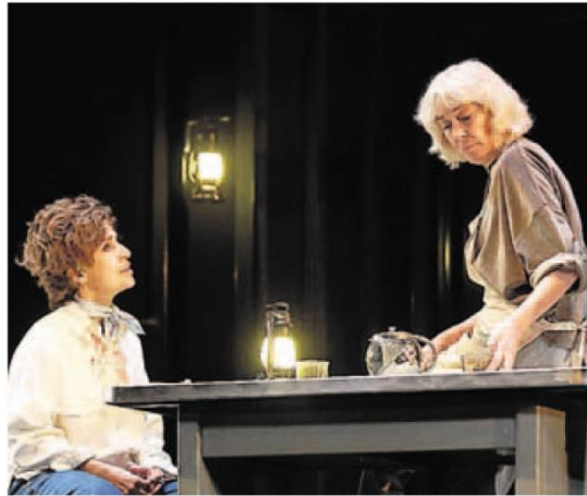
Adriana Ozores y Susi Sánchez, en "Los hijos".