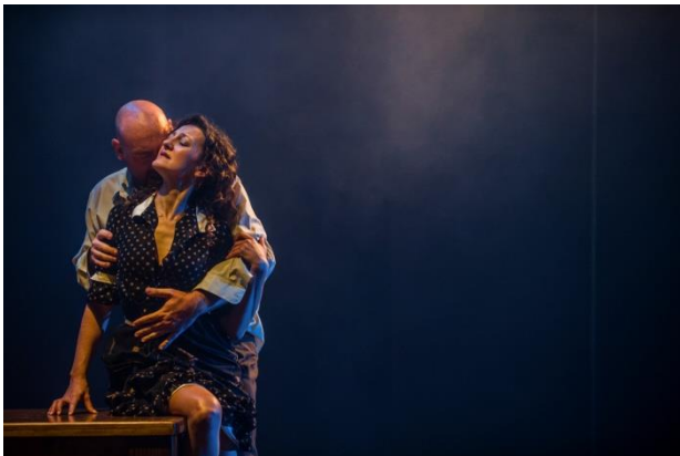
la malquerida (2014)