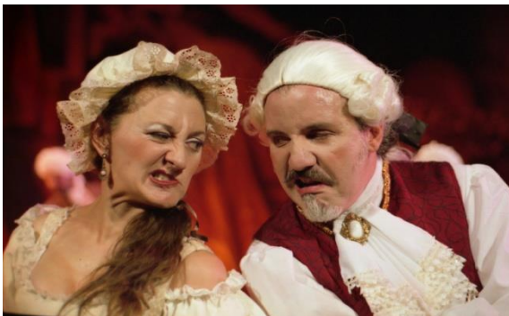
las bodas de fígaro (2004)