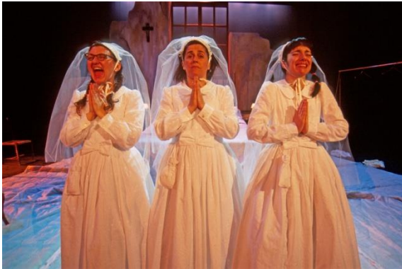
el día más feliz de nuestra vida (2005)