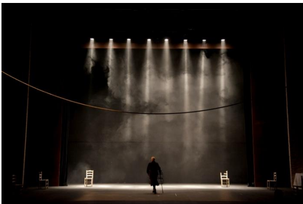
la casa de bernarda alba (2011)