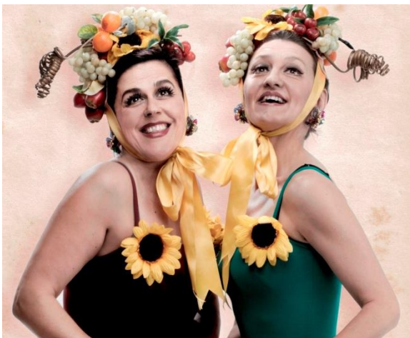
las reinas del orinoco (1997 - 2010)