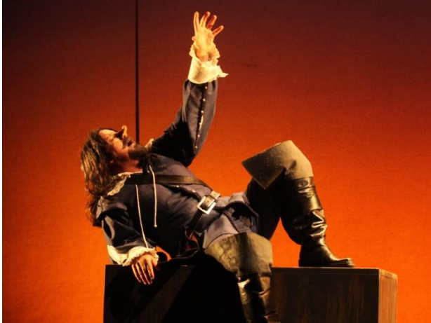
cyrano de Bergerac (2015)