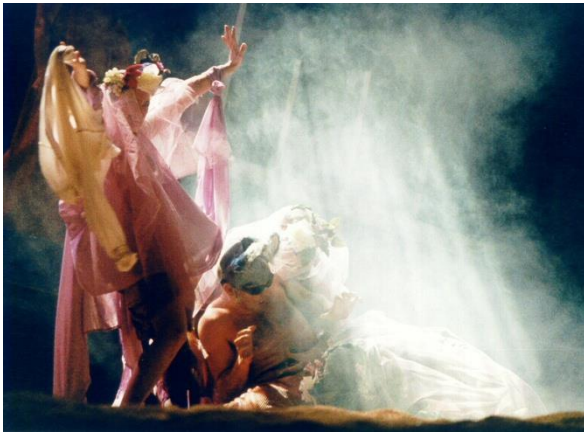
el sueño de una noche de verano (2000)