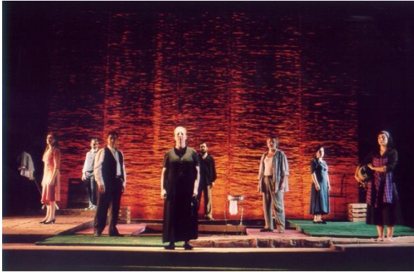
bodas de sangre (2003)